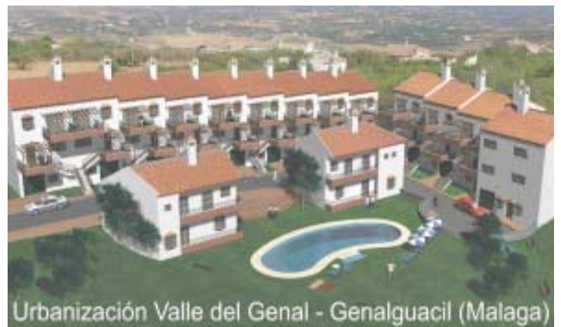
Urbanización Valle del Genal - Genalguacil (Malaga)