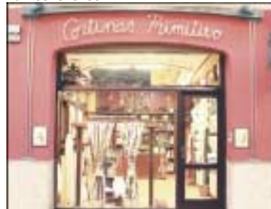
Cortinas Primitivo - Calle Almendra, 15 Tel: 952 876 430 - www.cprimitivo.com

CORTINAS PRIMITIVO Calle Almendra, 15 - Ronda Tel.: 952876430