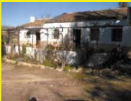
Casas totalmente acondicionadas para alquiler y turismo rural