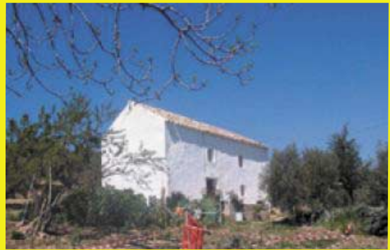
Villas, haciendas, viñedos y casas de campo rodeadas por maníficos paisajes de la Sierra de Ronda